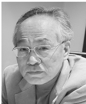
佐高 信 憲法行脚の会