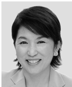
福島みずほ 参議院議員